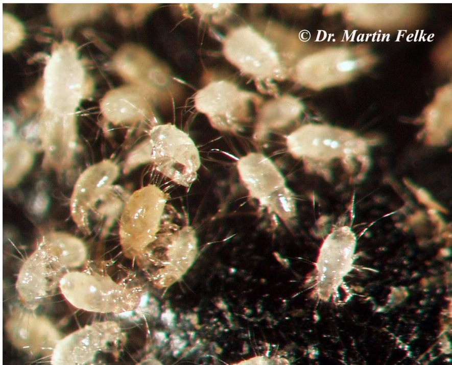
Abbildung 1: Vorratsschädliche Milben sind mit bloßem Auge kaum zu sehen

Die Mehlmilbe ( Acarus siro ) gehört wie alle Milben in die Gruppe der Spinnentiere. Im Gegensatz zu Insekten, die nur 6 Beine besitzen, haben Mehlmilben und andere Arten aus der Gruppe der Spinnentiere 8 Beine. Diese winzigen Milben sind mit bloßem Auge kaum zu erkennen und werden nur rund einen halben Millimeter lang. Der Körper der Tiere ist fast durchsichtig. Am Hinterende besitzen sie 2 Paar recht lange Schwanzhaare. Dieses Merkmal ist allerdings nur unter dem Mikroskop zu sehen.