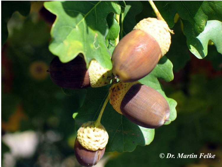
Abbildung 2: Eicheln gehören zur bevorzugten Nahrung